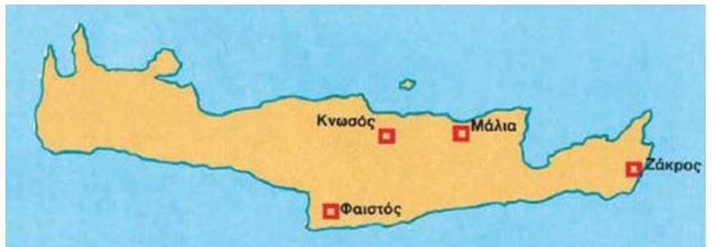
1. Τα σπουδαιότερα κέντρα του Μινωικού πολιτισμού.

Ο πολιτισμός που αναπτύχθηκε στην Κρήτη την εποχή του Χαλκού, δηλαδή πριν από 5000 χρόνια, ονομάστηκε « Μινωικός ». Πήρε αυτό το όνομα από τον μυθικό βασιλιά «Μίνωα» που βασίλευε στην πόλη της « Κνωσού » με το σπουδαίο της παλάτι. Ο βασιλιάς Μίνωας είχε ένα γιο, ο οποίος πήρε μέρος στους αγώνες στην Αθήνα. Εκεί νίκησε σ' όλα τ' αγωνίσματα και γι' αυτό κάποιοι Αθηναίοι, από τη ζήλια τους, τον σκότωσαν.